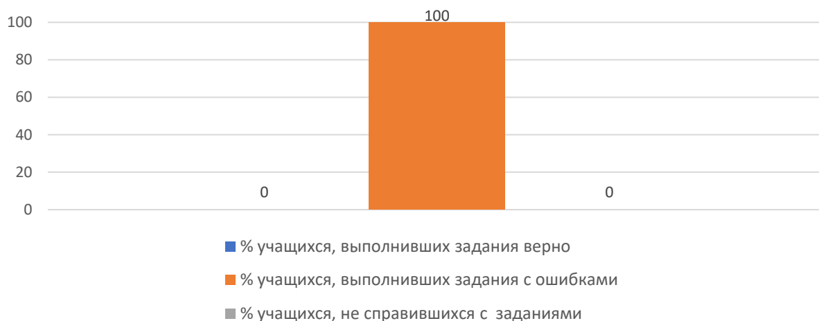
Рисунок 3. Основные результаты ДР по английскому языку

На рисунке 3 представлены основные результаты ДР по английскому языку в Тернейском муниципальном округе.